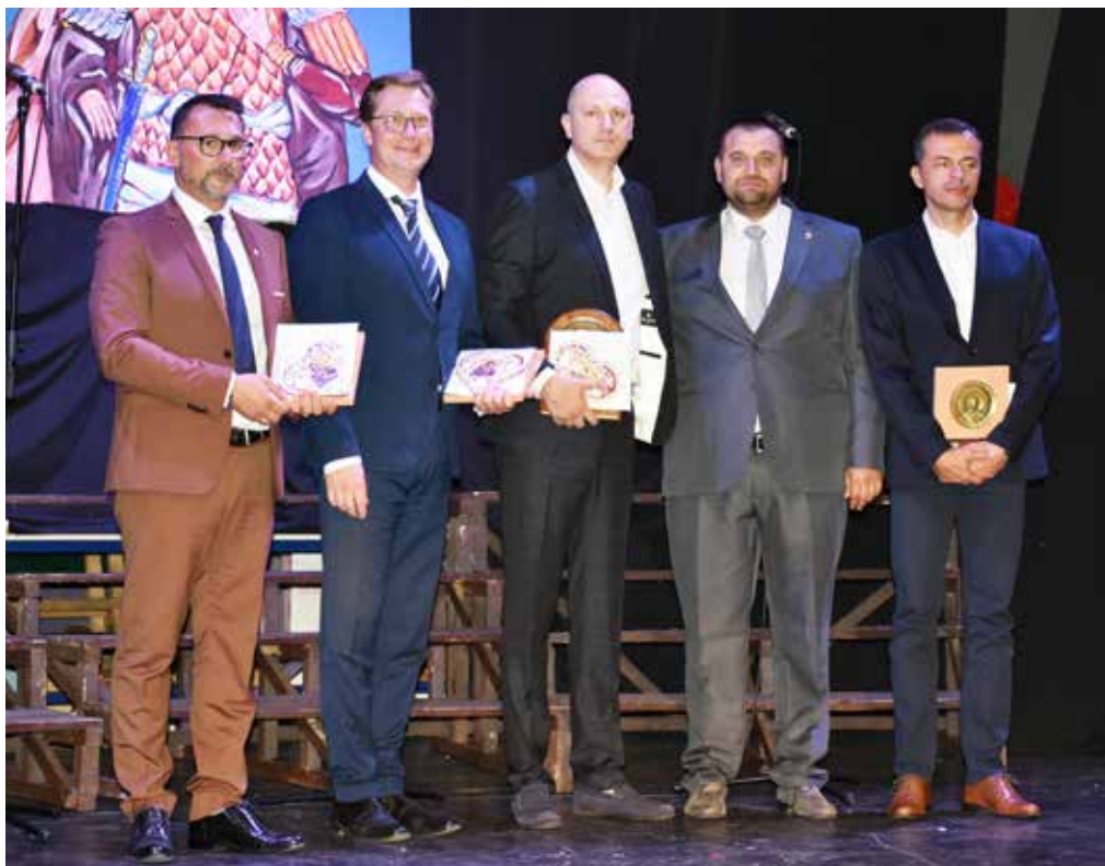
На прокоповданској академији уречена највећа признања Града Прокупља (стр. 6-7)