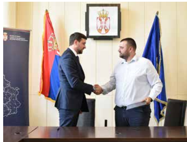
Потписан Уговор о изградњи дечијег игралишта у Малој Плани (стр. 3)