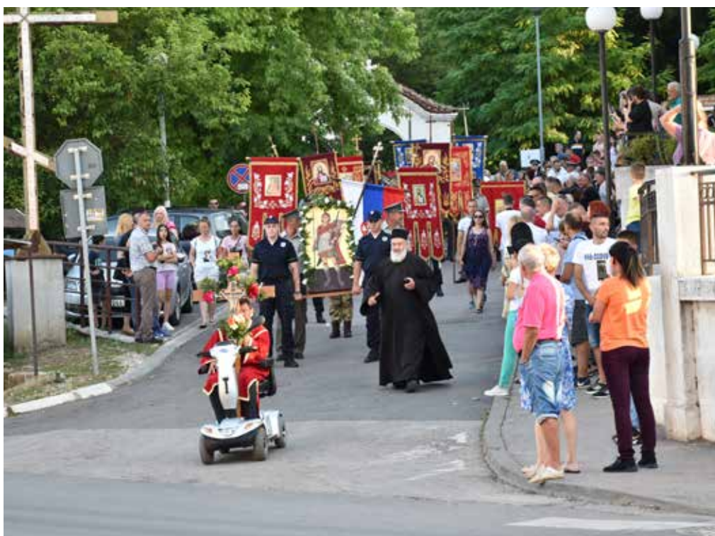
У част славе Свети Прокопије традиционална литија кроз град (стр. 5)