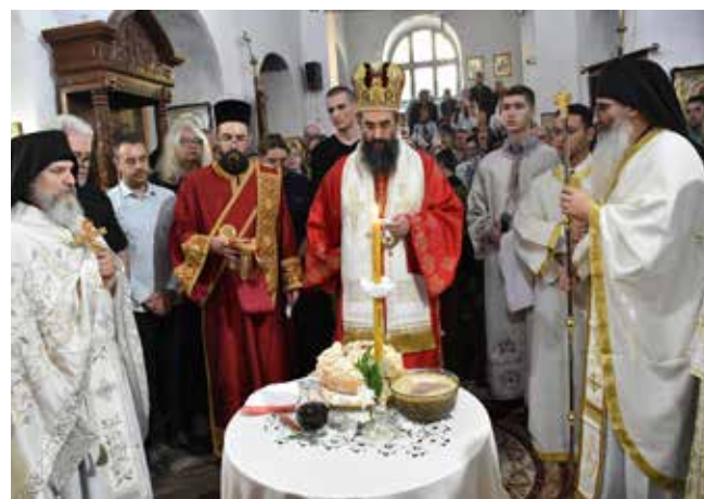
Свечана јутарња литургија у цркви Свети Прокопије (стр.8)