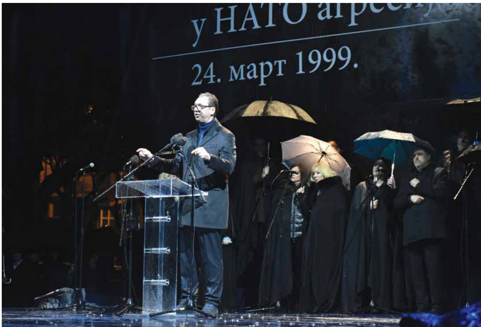
Дан сећања на страдале у НАТО агресији 1999. године (стр.4-5)

Прокупље • Фебруар – Март 2024 • Број 149(429)