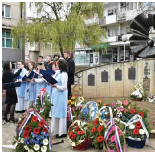
Полагање венаца на споменик страдалима у ратовима од 1990 – 1999 године (стр. 8)