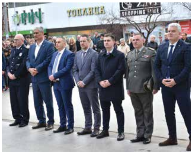
Обележена 107. годишњица Топличког устанка (стр. 9)