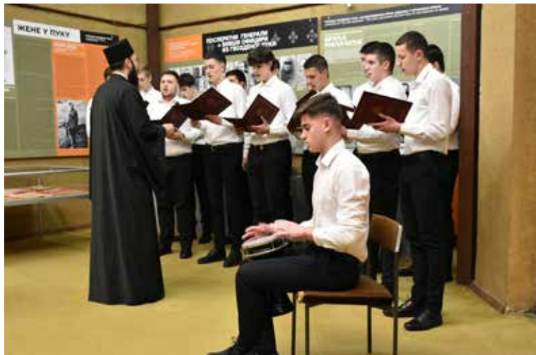
свега треба да будемо део црквеног живота, јер наша црква је ризница благослова и благодети Божје. Црква је сабор богопозваних људи,

место нашег духовног узрастања и место нашег живота са Богом, рекао је протојереј Дејан Крстић.