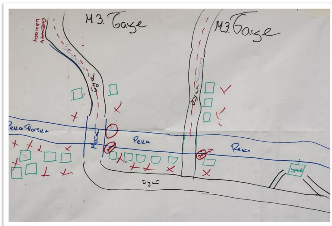
Слика 2: Мапа ризика од природних катастрофа

Како би се просторно схватили постојећи капацитети и рањивости који су претходно идентификовани, учесници су мапирали заједницу, са фокусом на рањивим подручјима. Кроз ову активност дошли су до заједничког разумевања географске распоређености ризика и опасности у заједници (нпр. поплаве, клизишта, ерозија тла, суша и др.), расположивих ресурса који помажу заједници да се носи са катастрофама, као и људи који су најугроженији током катастрофа. Просторно мапирање пружа слојевиту перспективу о томе како природне катастрофе угрожавају заједницу, као и њихов утицај на домаћинства.