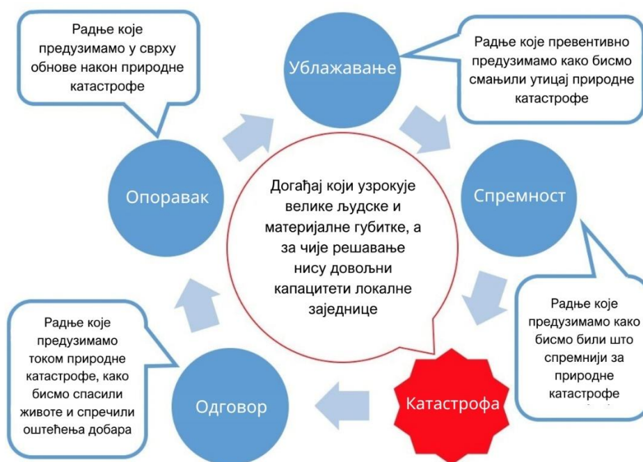
Слика 1: Циклус управљања ризиком од катастрофа

Ови циљеви усмерени су на свеобухватно планирање за све фазе циклуса ризика од природних катастрофа, тако да МЗ Бресничкић може дати приоритет акцијама и управљати ресурсима за ублажавање, припрему, одговор и опоравак од будућих катастрофа.