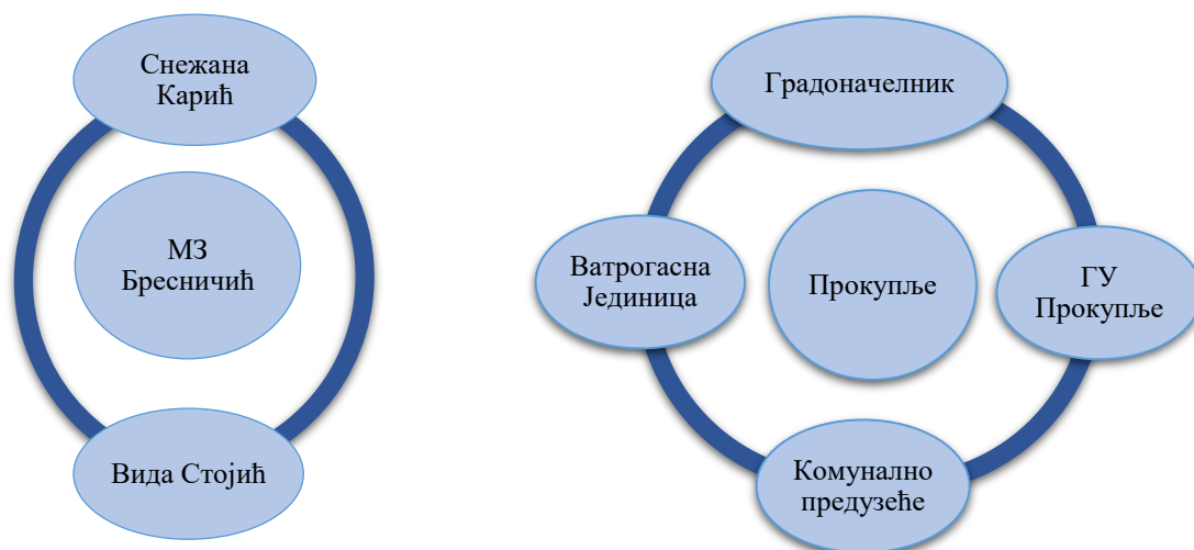
Графикон 1 и 2: Институције и актери на нивоу месне заједнице и града

Представници МЗ заједно са члановима радне групе Града Прокупља идентификовали су институције, организације и појединце који се баве различитим делатностима, које су у већој или мањој мери везане за смањење ризика од катастрофа. Први графикон приказује институције, организације и/или појединце на нивоу месне заједнице, док други приказује институције на нивоу Града Прокупља.