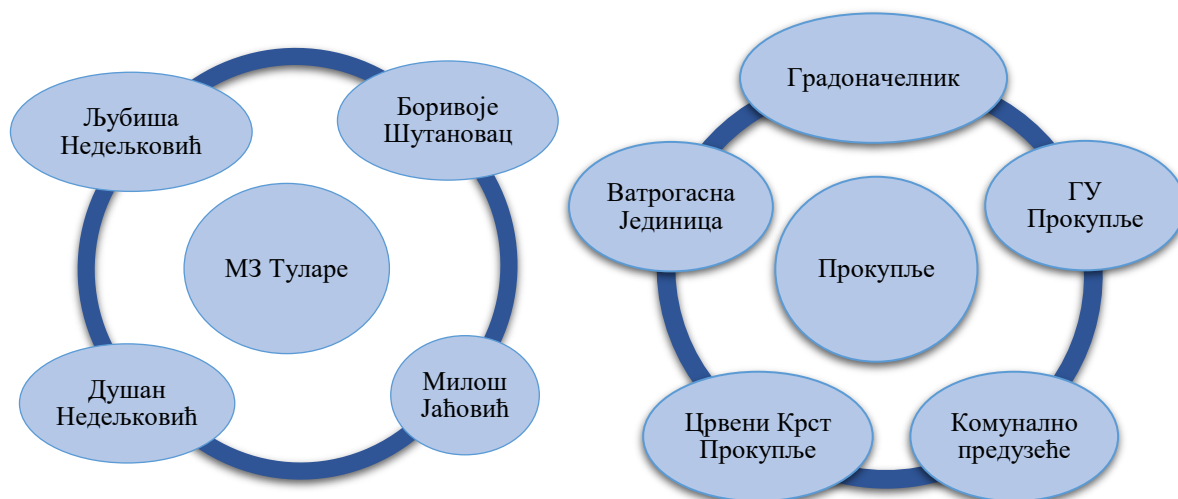
Графикон 1 и 2: Институције и актери на нивоу месне заједнице и града

Представници МЗ заједно са члановима радне групе Града Прокупља идентификовали су институције, организације и појединце који се баве различитим делатностима, које су у већој или мањој мери везане за смањење ризика од катастрофа. Први графикон приказује институције, организације и/или појединце на нивоу месне заједнице, док други приказује институције на нивоу Града Прокупља.