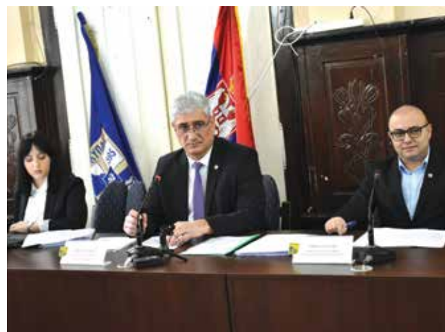
Усвојен буџет Града Прокупља за 2026. годину