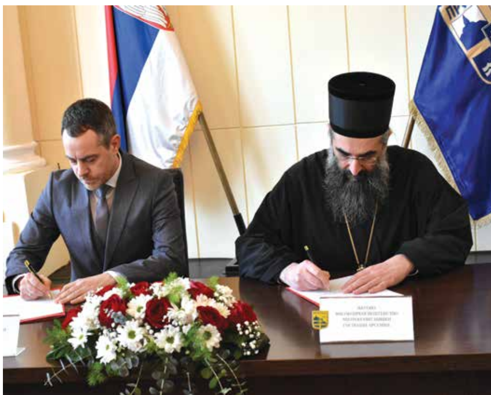
Потписан уговор о изградњи две куће за социјално угрожене породице