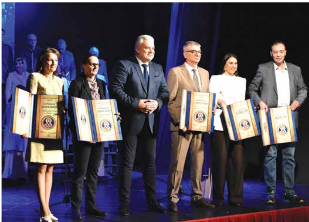
Уручена Светосавска признања

ISSN 1452-0435 Прокупље • ДЕЦЕМБАР 2025 – ЈАНУАР 2026 • Број 160(440)