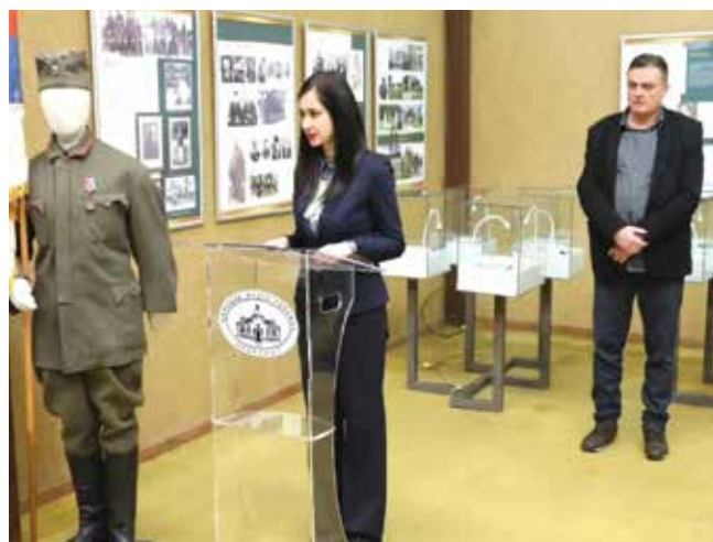
Отворена изложба „Забрављени јунаци Топлице“